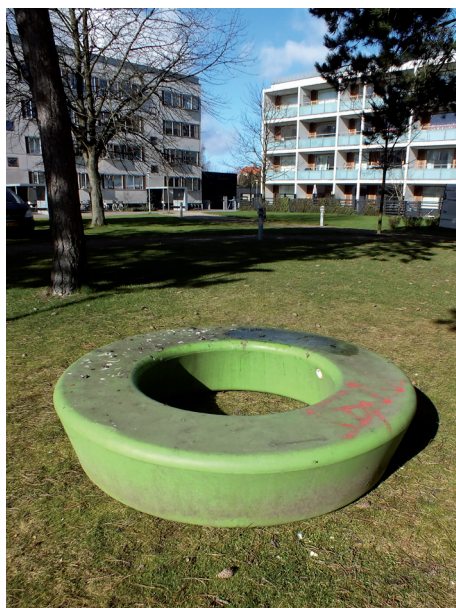
1: Før rengøring (LOOP fra en park i København - de var syv år gamle da vi tog billederne).