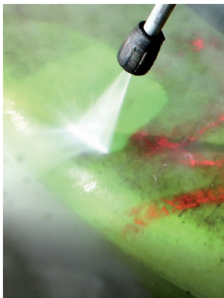
4: Selv graffiti kan fjernes sådan.