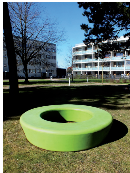
6: Slutresultat. Efter rengøring kan vinylpleje bruges (samme type som bruges til bilinteriør) til at shine produktet.