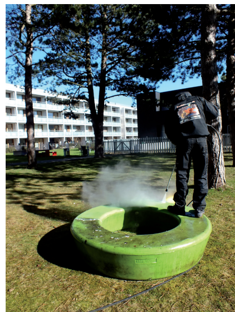
3: Højtryksrens med varmt vand.