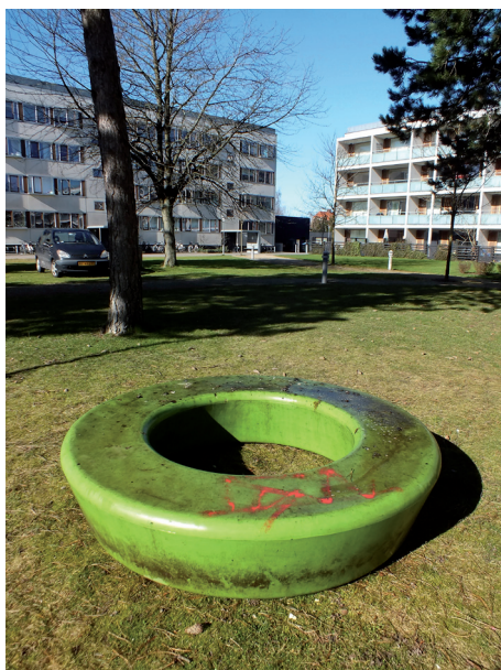
2: Spray med grundrens. Lad midlet virke i 5 min. inden højtryksrens påbegyndes.